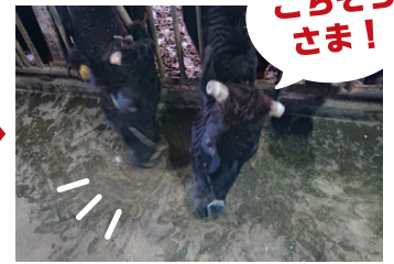
ヘパウルソ5%フレーバー